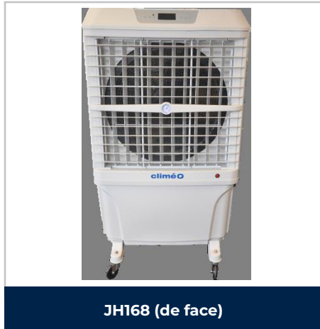
JH168 (de face)

Compacts et efficaces, les rafraichisseurs CLIMEO JH168 sont conçus pour les locaux de moyennes et grandes dimensions. Ils assurent une baisse de la température ambiante par l'action naturelle de l'eau et produisent un climat intérieur confortable en optimisant la température et l'hygrométrie.