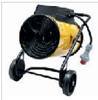
Générateur d'air chaud GEB 40