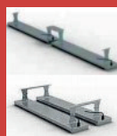
Pièce de jonction de deux HOT TOP en ligne