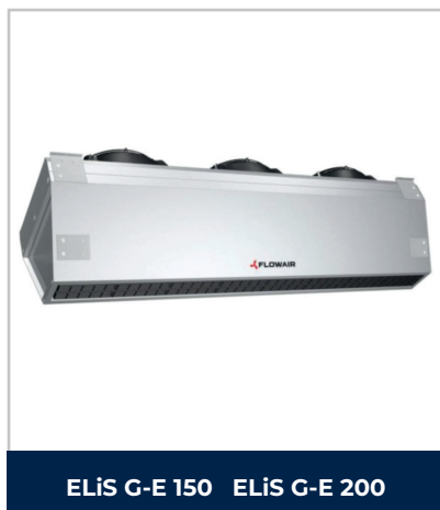
ELIS G-E 150 ELIS G-E 200

Les rideaux d'air chaud électriques industriels FLOWAIR de la gamme ELIS G sont équipés de batteries électriques performantes qui chauffent l'air par un ventilateur à vitesse variable. Ces appareils sont conçus pour fonctionner à l'intérieur et peuvent être montés horizontalement ou verticalement. Idéal pour protéger les entrées d'air froid d'une porte sectionnelle de hauteur maxi de 7 m.