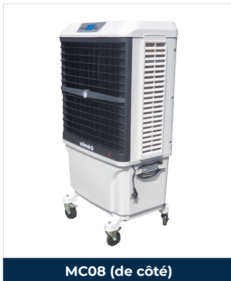
MC08 (de côté)