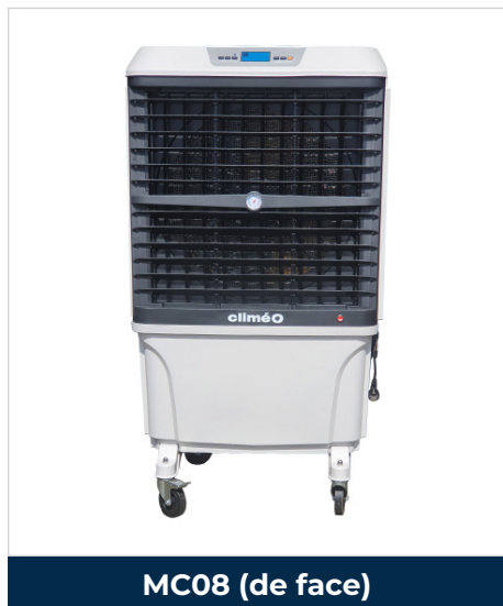
MC08 (de face)

Compacts et efficaces, les rafraichisseurs CLIMEO MC08 sont conçus pour les locaux de moyennes et grandes dimensions. Ils assurent une baisse de la température ambiante par l'action naturelle de l'eau et produisent un climat intérieur confortable en optimisant la température et l'hygrométrie.