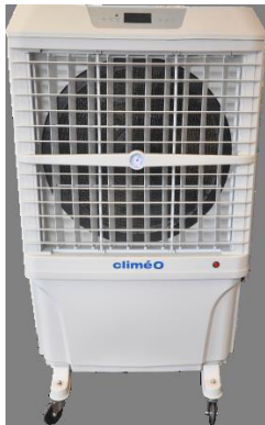
JH168 (de face)

Compacts et efficaces, les rafraichisseurs CLIMEO JH168 sont conçus pour les locaux de moyennes et grandes dimensions. Ils assurent une baisse de la température ambiante par l'action naturelle de l'eau et produisent un climat intérieur confortable en optimisant la température et l'hygrométrie.