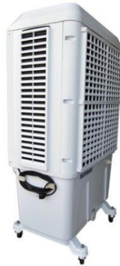
JH168 (de côté)