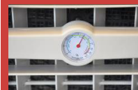
Hygostat indicatif sur face avant