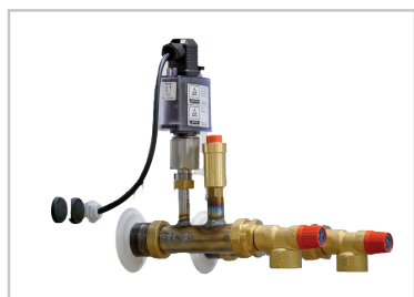
Équipement de sécurité

Vous avez besoin de compléter votre système de chaudière ?